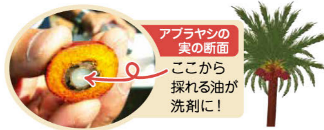
アブラヤシの 実の断面 ここから 採れる油が 洗剤に!

セフターシリーズは蛍光剤無配合なので、衣類が白っぽくならず自然な色合いが長持ちします。