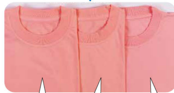
新品 コープのセフターEで洗濯 市販の蛍光増白剤配合洗剤で洗濯

セフターシリーズは蛍光剤無配合なので、衣類が白っぽくならず自然な色合いが長持ちします。