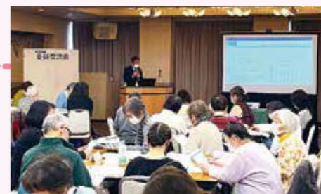
ミニ学習会の様子

思いを口に出すことで、自分の中でも確認したり次が見えてきたり、多様な意見が聞けて良かったです。