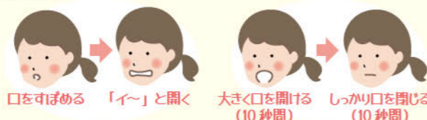
口をすぼめる 「い〜」と開く 大きく口を開ける (10秒間) しっかり口を閉じる (10秒間)

「噛む」「飲み込む」などの機能では、口や顔面周囲の多くの筋肉が協働しています。これらの筋肉を意識的に動かすトレーニングによって口の機能低下の予防が期待できます。日本歯科医師会のホームページ ( https://www.jda.or.jp/oral_frail/gymnastics/ ) には「頬を膨らませる、すぼめる」「舌を伸ばす、頬に押し付ける」などの様々な口腔体操が紹介されています。ぜひ、取り組んでみてください。