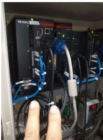
新しいシステム装置