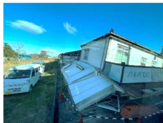
避難指示が解除されても住民が戻らず崩れたままの建物

電話または、QRコードからお申込みください。 ※当日ご都合が悪い方はQRコードから見逃し配信をお申込み下さい。