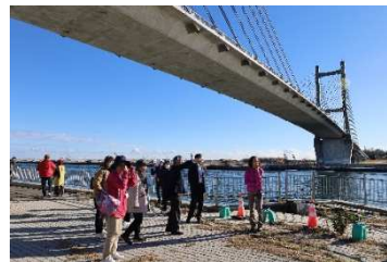
津波が橋げたまで押し寄せた「松川浦大橋(相馬市)」