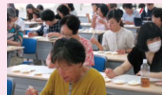
センターでの試食風景(6～7月実施)