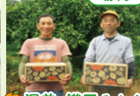
渥美・鐵平みかん