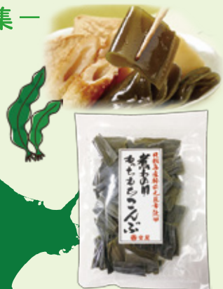
煮物用もちもち昆布