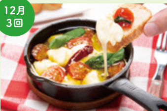
チーズのアヒージョ イタリア産モッツァレラチーズ使用