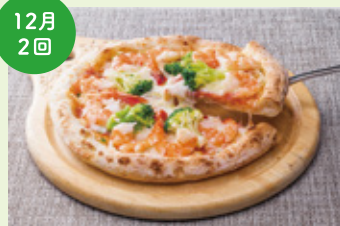
海老とブロッコリーのピザ