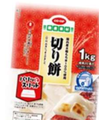
CO・OP切り餅シングルパック