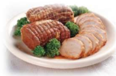
とやま生協オリジナル商品 じっくり煮込んだ煮豚くん