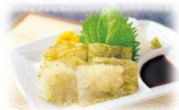
富山湾白エビ昆布〆