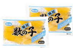
北海道産味付数の子