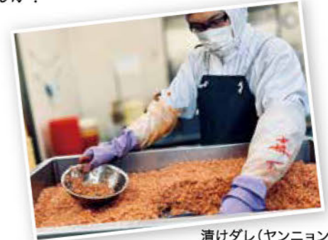
漬けダレ(ヤンニョンジャン)の製造

食べやすいけど本格的!な『COOP 家族deぱっくぱくキムチ』を食べて、暑い夏を乗りきりませんか?