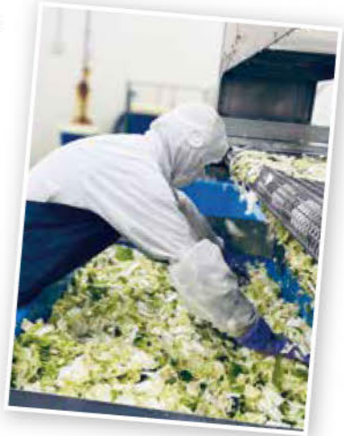
野菜の塩漬け作業職人さんの手作業です