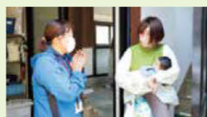
おむつと離乳食（きらきらステップ商品）をお届け