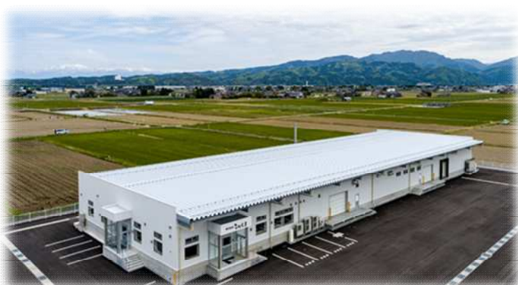
となみ工場（砺波市坪内）