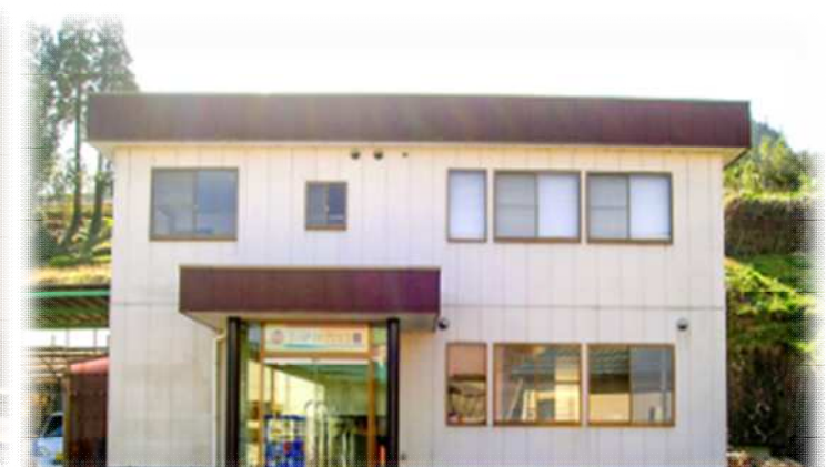
本社（砺波市庄川町）