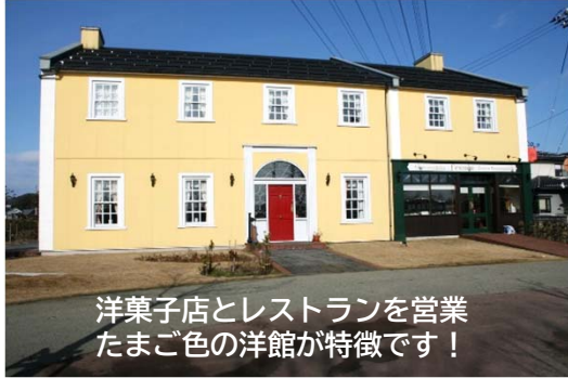
洋菓子店とレストランを営業 たまご色の洋館が特徴です！