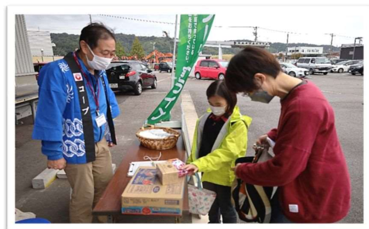
↑富山ブロックせいきょうまつりでの様子

また、全会場でフードドライブのコーナーが設けられ、まつりに来られた組合員や地域の方々が持ち寄った食品は、富山ブロックせいきょうまつりで19人から14.5kg、西部ブロック生協まつりで35人から73kg、東部センターまつりで19人から101.7kg、合計189.2kgと大変多くの方にご協力いただきました。ありがとうございました。