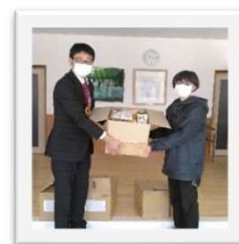
←魚津市の社会福祉協議会に寄付しました。