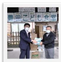
←富山市内の福祉施設や子ども食堂などに寄付しました。