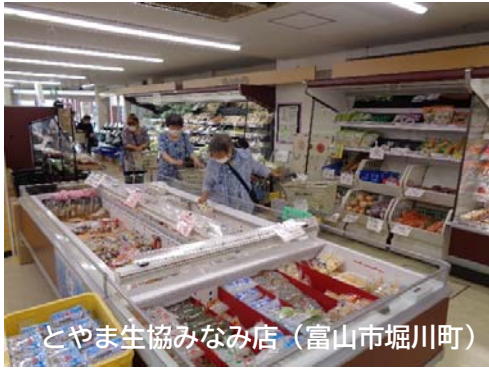
とやま生協みなみ店(富山市堀川町)

富山県中央植物園の広大な敷地で、季節に応じた見ごろの植物を観賞します。世界の植物の温室内展示もあり、さまざまな植物を学び、楽しめる機会です。また近場の「ますのすしミュージアム」にも立ち寄り、昼食をいただきます。